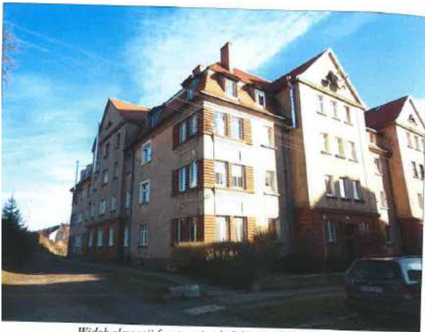
Widok elewacji frontowej – ul. Juliusza Słowackiego.

na sprzedaż lokalu mieszkalnego Nr 8, znajdującego się w budynku położonym w Lubaniu przy ul. Juliusza Słowackiego 15B wraz z udziałem we współwłasności nieruchomości gruntowej (działka nr 58/10, AM 14, Obręb I o powierzchni 200 m 2 , JG1L/00022161/6)